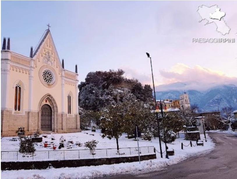
Chiesa di S. Giorgio e S. Leonardo, Roccabascerana