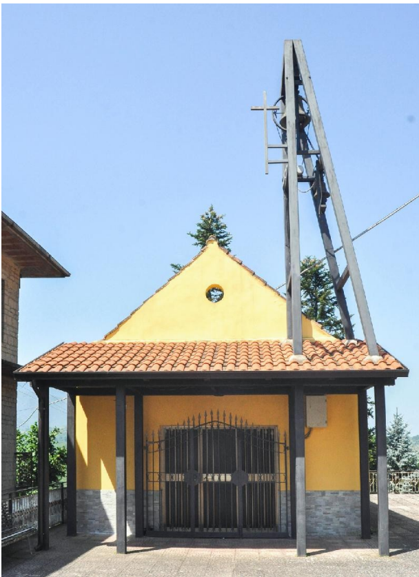
Chiesa di S. Antonio, Zolli