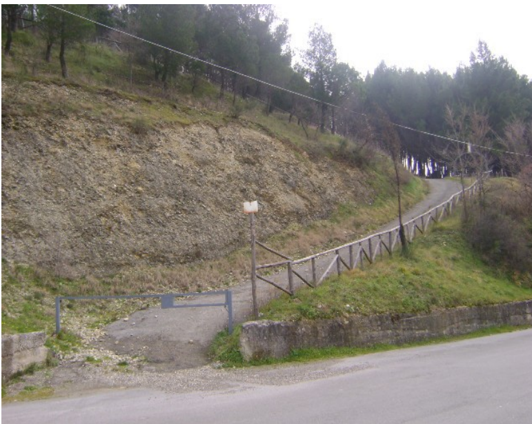
Inizio del percorso per il Monte Colonna

Questi luoghi offrono l'occasione per interessanti escursioni in una natura incontaminata, dove con un po' di fortuna ci sarà la possibilità di ammirare tassi e tritoni cretati essendo l'habitat ideale di queste specie faunistiche e anfibia tipiche del Partenio.