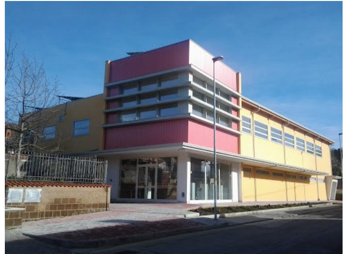
Sede della Biblioteca Comunale