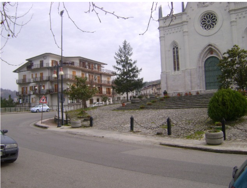
Piazza M. Imbriani – Roccamascerana