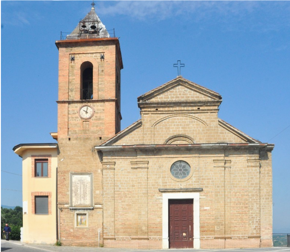
Chiesa di S. Stefano e Maria Santissima, Squillani