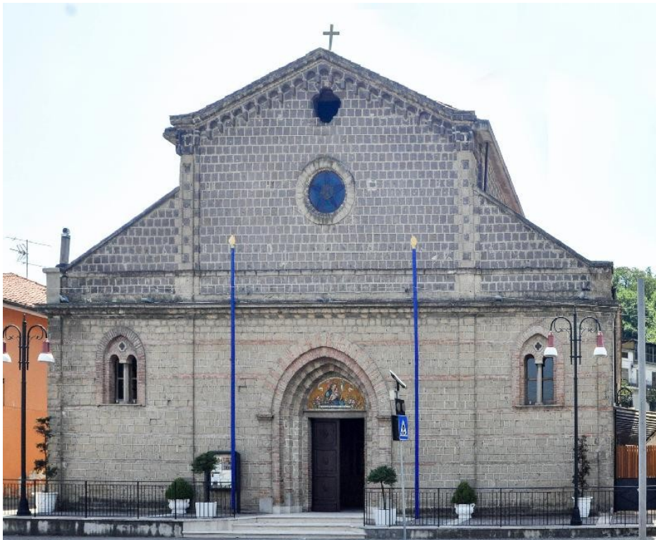
Chiesa del Carmine, Tufara Valle