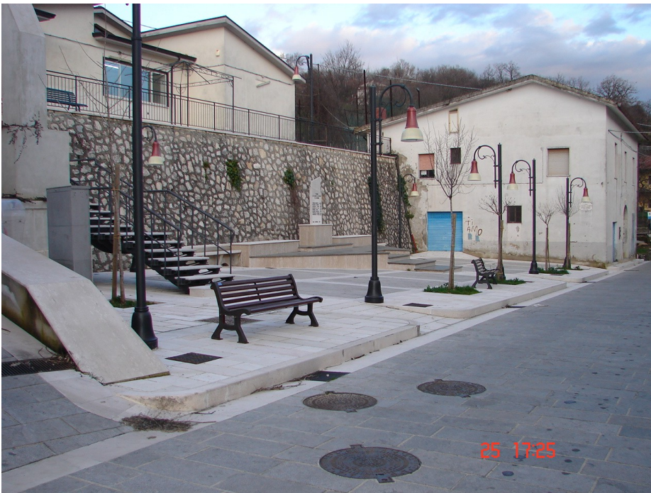
Piazza "Covino Giuseppe" - Tuoro, Roccabascerana