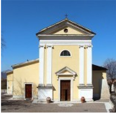
Chiesa di S. Nicola, Tuoro