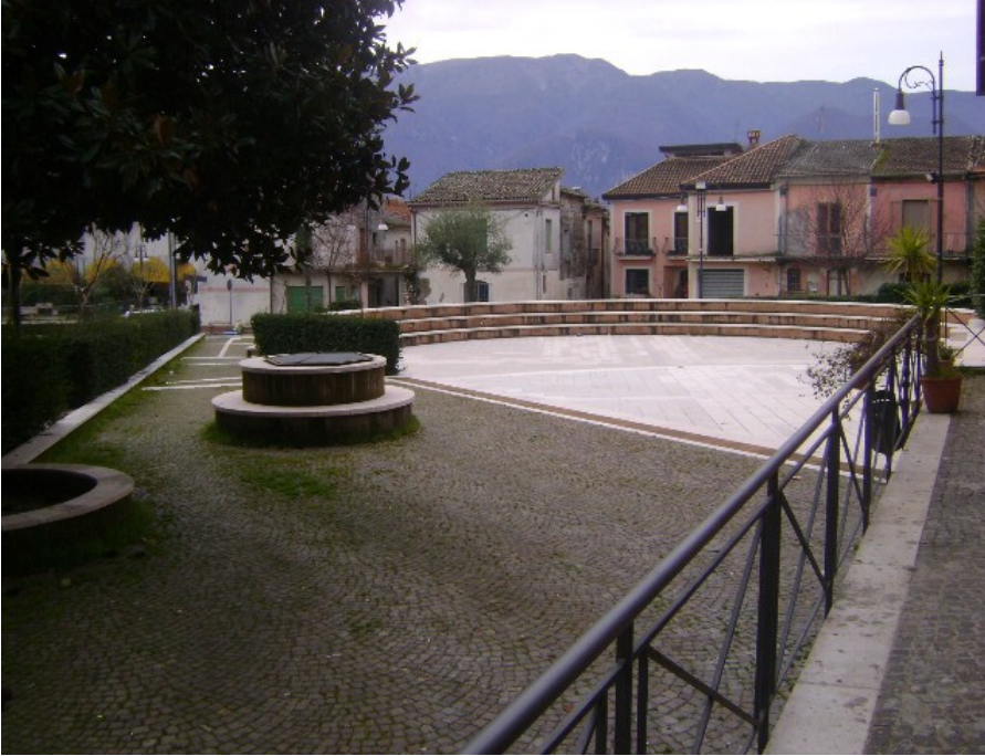
Piazza "Antonio de Curtis" - Cassano Caudino, Roccabascerana