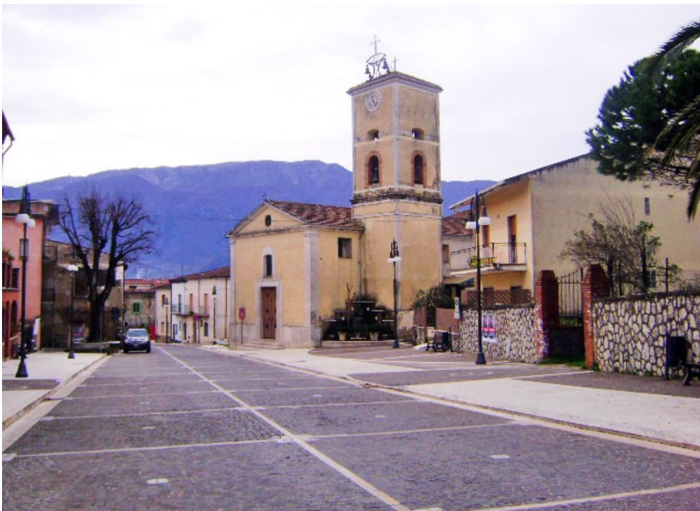
Chiesa di S. Andrea apostolo, Cassano Caudino